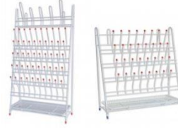
Escorredor para tubos de ensaio