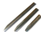
Espátula de meia cana