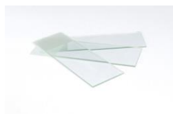
Lamina de vidro