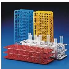
Suporte para tubos de ensaio