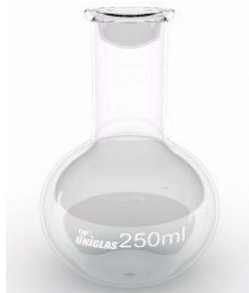
Balão de fundo plano