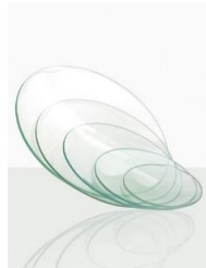
Vidro de relógio