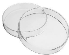
Caixa de petri