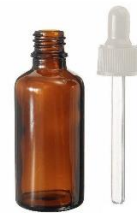
Frasco conta gotas