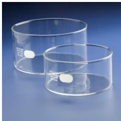
Tina de vidro