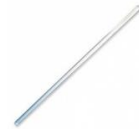
Vareta de vidro