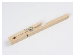
Pinça de madeira